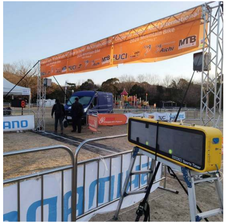
タイマー フィニッシュライン