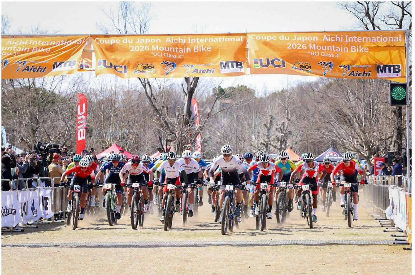
男子のスタート 女子のロックセクション