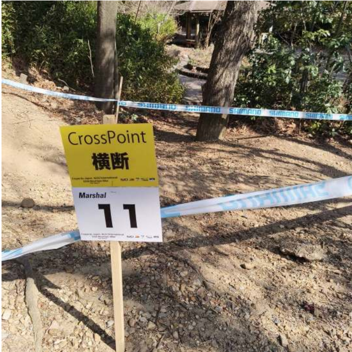
マーシャルポイント表示