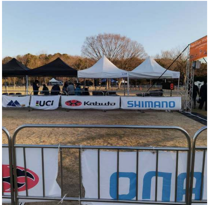
フィニッシュエリア