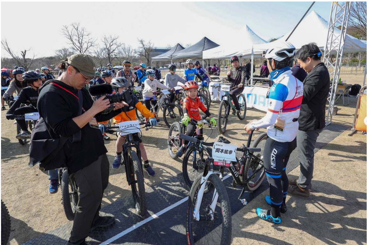
市民ファンライド ファンライドでの指導