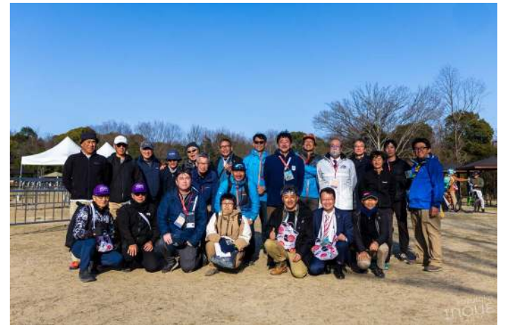
競技役員 (国際連盟、日本連盟、県連盟)