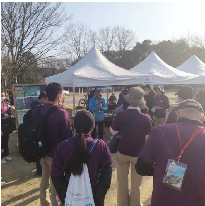
ボランティア・ブリーフィング