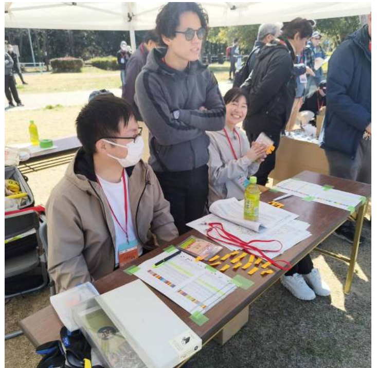
ボランティア等受付