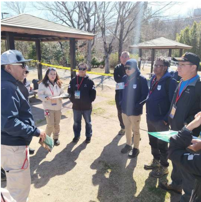
競技役員ブリーフィング