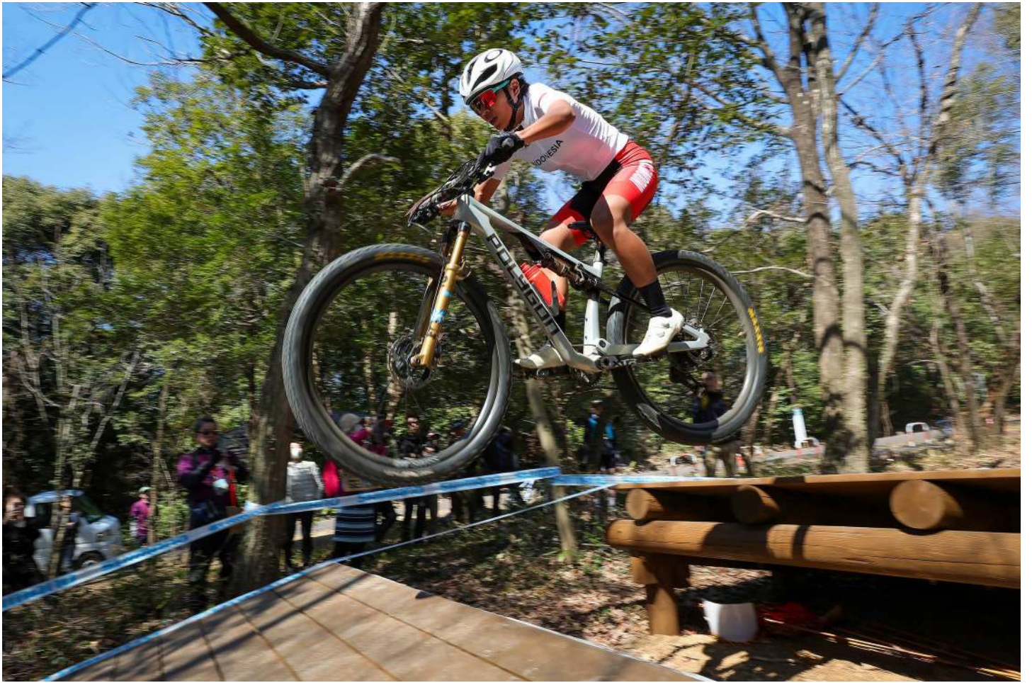
キャニオンジャンプ テーブルトップジャンプ