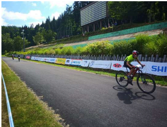
ゴールには電光掲示や協賛企業の看板も設置