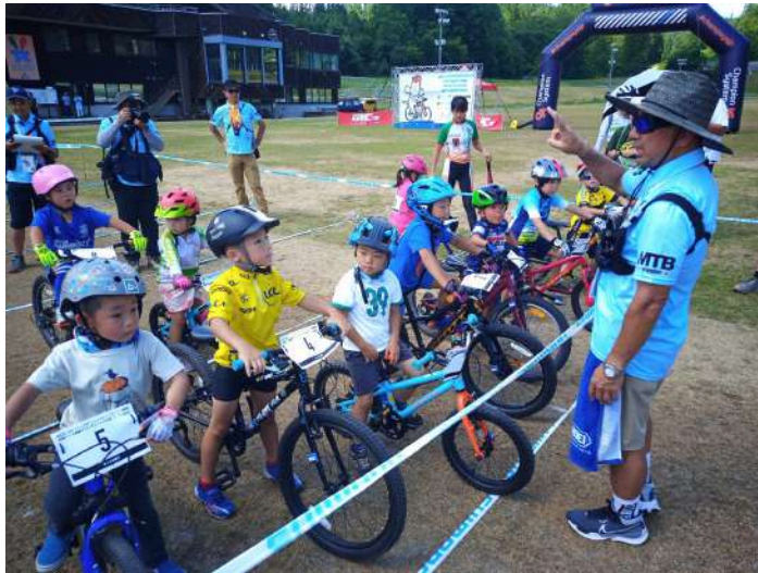
未就学児によるレースも本格的に行われた