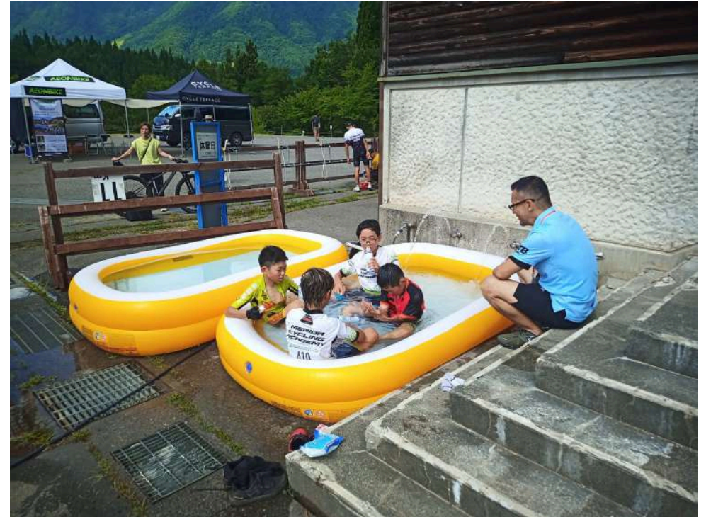
熱中症症状（軽症）者にはドクター指導の元、全身浴にて冷却処置を実施し、症状悪化の選手を出すことなく大会を終えることができた